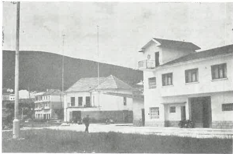
Un bello aspecto urbanístico