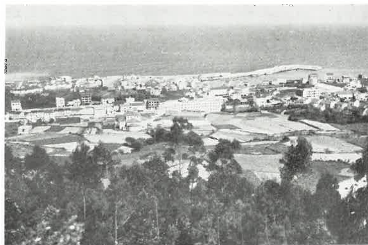
BURELA con su puerto y sus pesqueros, ríe jubilosa ante la gloria del mar

A las 6 de la tarde, Grandioso Baile, a cargo de las famosas Orquestas «Spallant», de La Coruña y «Variedades», de Vivero; prolongándose hasta las más altas horas de la madrugada.