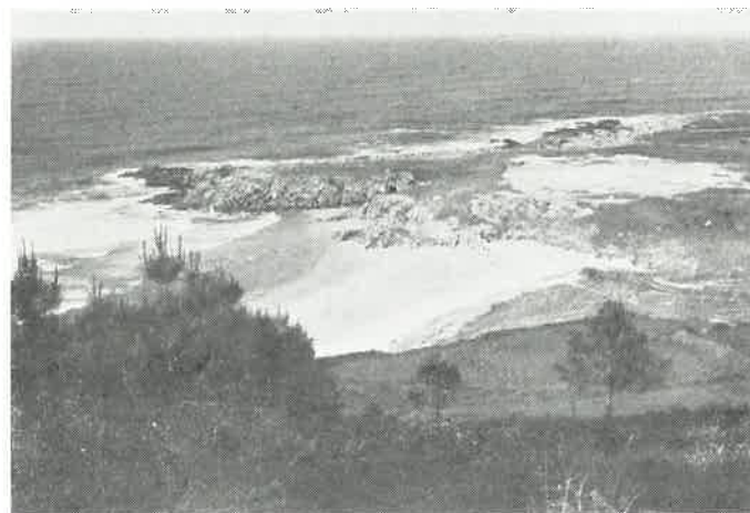
El belló remanso de la playa, remanso de paz y belleza en las cercanías de Burela

A las 11 de la noche, se quemará gran número de tracas y lucería.