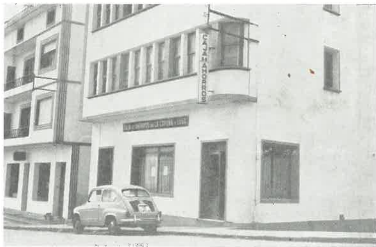
En lo económico y social la villa se remozó